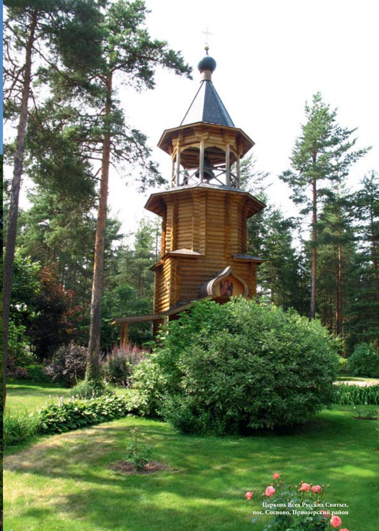
Церковь Всех Русских Святых, пос. Сосново, Приозерский район