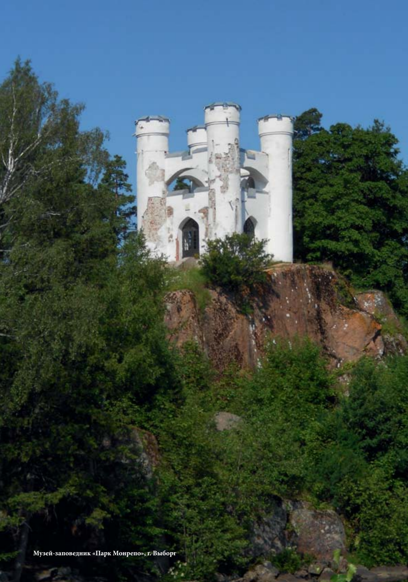
Музей-заповедник «Парк Монрепо», г. Выборг