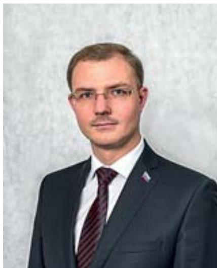
Александр Перминов, лидер фракции «Справедливая Россия»:

«ДЕПУТАТЫ ДОЛЖНЫ НАУЧИТЬСЯ УВАЖАТЬ ДРУГ ДРУГА»