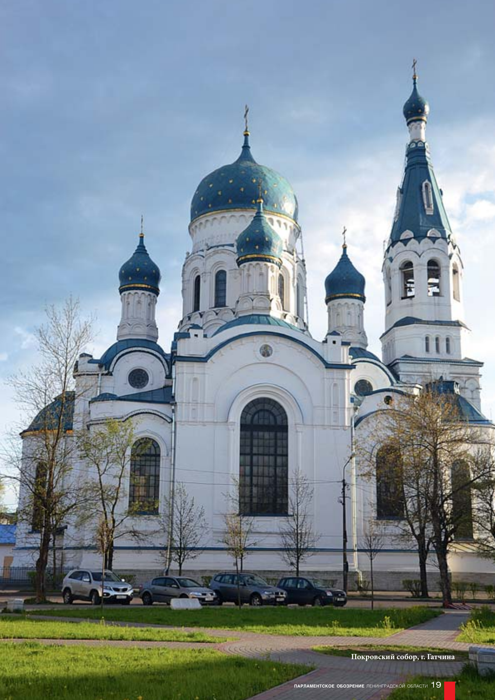
Покровский собор, г. Гатчина